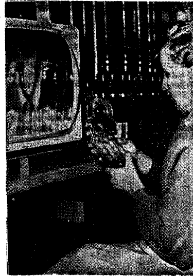
Durch ein Spezialgerät, das die Konturen vergrößert, kann jede unsaubere Flasche sofort aussortiert werden

Und was dieses Wunderwerk der Technik auszeichnet, zeigt sich auch bei allen anderen technischen Einrichtungen des Milchhofes. Blitzend saubere Leitungen und Gefäße, ein vorzüglich ausgestattetes Laboratorium, eine Brunnenanlage, der sehr viel Aufmerksamkeit geschenkt wurde — hier wird nicht das Eintreten, was andernorts die Gemüter mit Recht beunruhigte. Wuppertal darf stolz auf seinen neuen